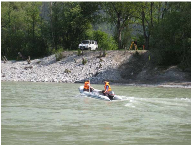
Vermessungsteam unterwegs am Inn Quelle: Amt der Tiroler Landesregierung, Abt. Wasserwirtschaft

Arbeitspakete der „Abflussuntersuchung Tirol I“. Auf Basis dieser Abflussuntersuchungen werden unter anderem Gefahrenzonenpläne für gefährdete Siedlungsbereiche erstellt, und in weiterer Folge Maßnahmenkonzepte für den Schutz vor Hochwassergefahren erarbeitet. Quelle: Amt der Tiroler Landesregierung, Abt. Wasserwirtschaft