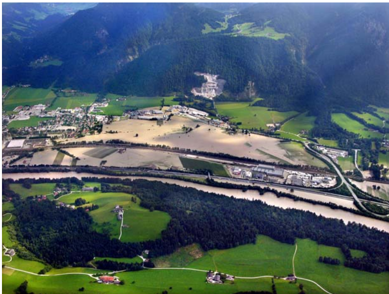
Überflutungen bei Wörgl, Hochwasser 2005